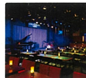
ブルーノートジャパン