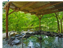
東急ハーヴェストクラブ鬼怒川

会員制リゾートホテル「東急ハーヴェストクラブ」が低料金で利用できる他、「ブルーノートジャパン」グループの施設が特別料金で、利用できます。